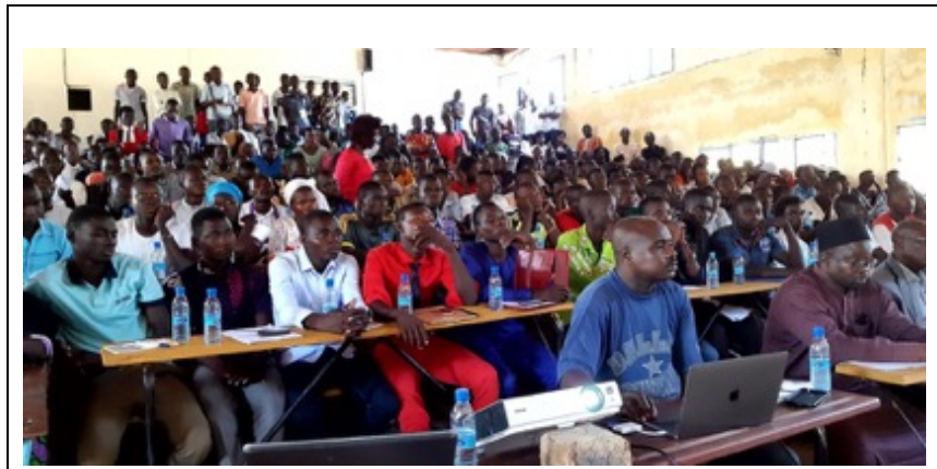
Conférence débat « les enjeux du pastoralisme » à l'Université de Sarh Samedi 2 Novembre 2019

Au regard des questions posées par les étudiants, on se rend bien compte que, les enjeux et les défis relatifs aux systèmes pastoraux sont peu connus par ces futurs cadres du pays