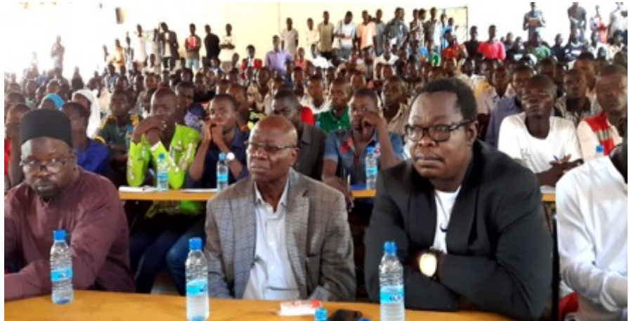
Photo : Conférence débat sur les enjeux et défis du pastoralisme à l'université de Sarh